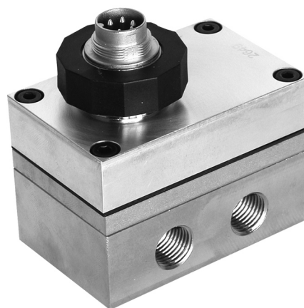
Medium Pressure Version