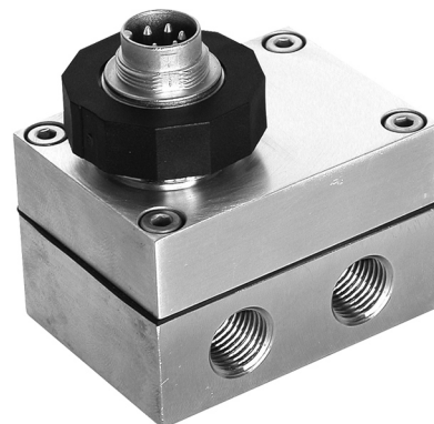
Low Pressure Version